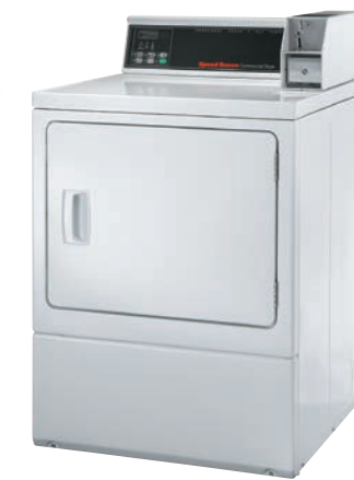
20G ガス式 乾燥機 100V単相 20E 電気式 乾燥機 電気式200V 単相3線式 50/60Hz