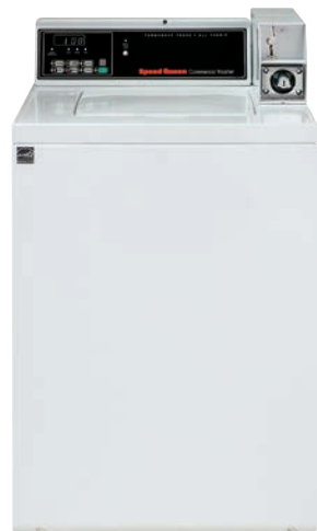
HT20 洗濯機 100V単相