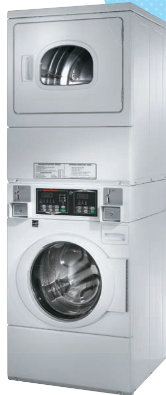
HWG ガス式 乾燥機 100V単相 HWE 電気式 乾燥機 電気式3線式 50/60Hz 洗濯機