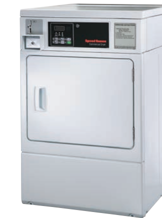
HG ガス式 乾燥機 100V単相 HE 電気式 乾燥機 電気式200V 単相3線式 50/60Hz