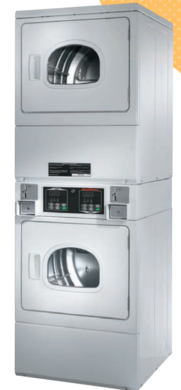
20GW ガス式 乾燥機 100V単相 20EW 電気式 乾燥機 電気式200V 単相3線式 50/60Hz