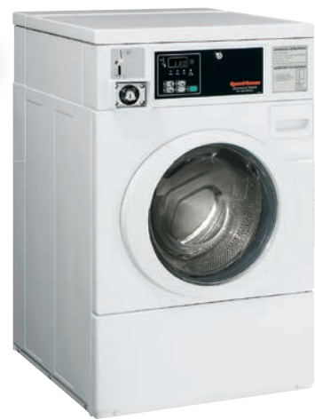
HW 洗濯機 100V単相