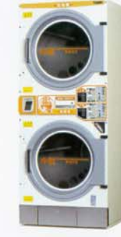
コイン式2段ガス乾燥機 CT-144W