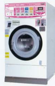
コイン式洗濯乾燥機 SF-224C