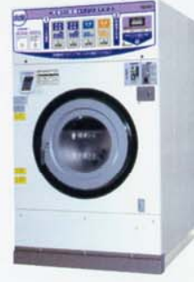
コイン式洗濯乾燥機 SF-324C