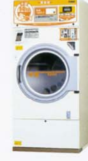
コイン式ガス乾燥機 CT-144G