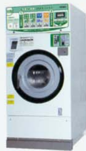
コイン式洗濯乾燥機 SF-124C